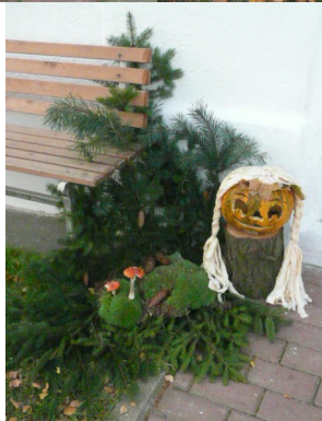
Květoslava Geržová (šampaňské)