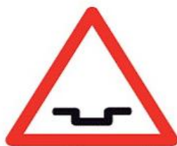
A07d Pozor díra