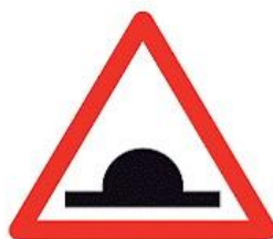
A07c Velký hrbol