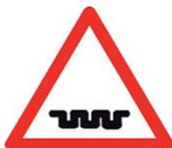
A07e Pozor díry